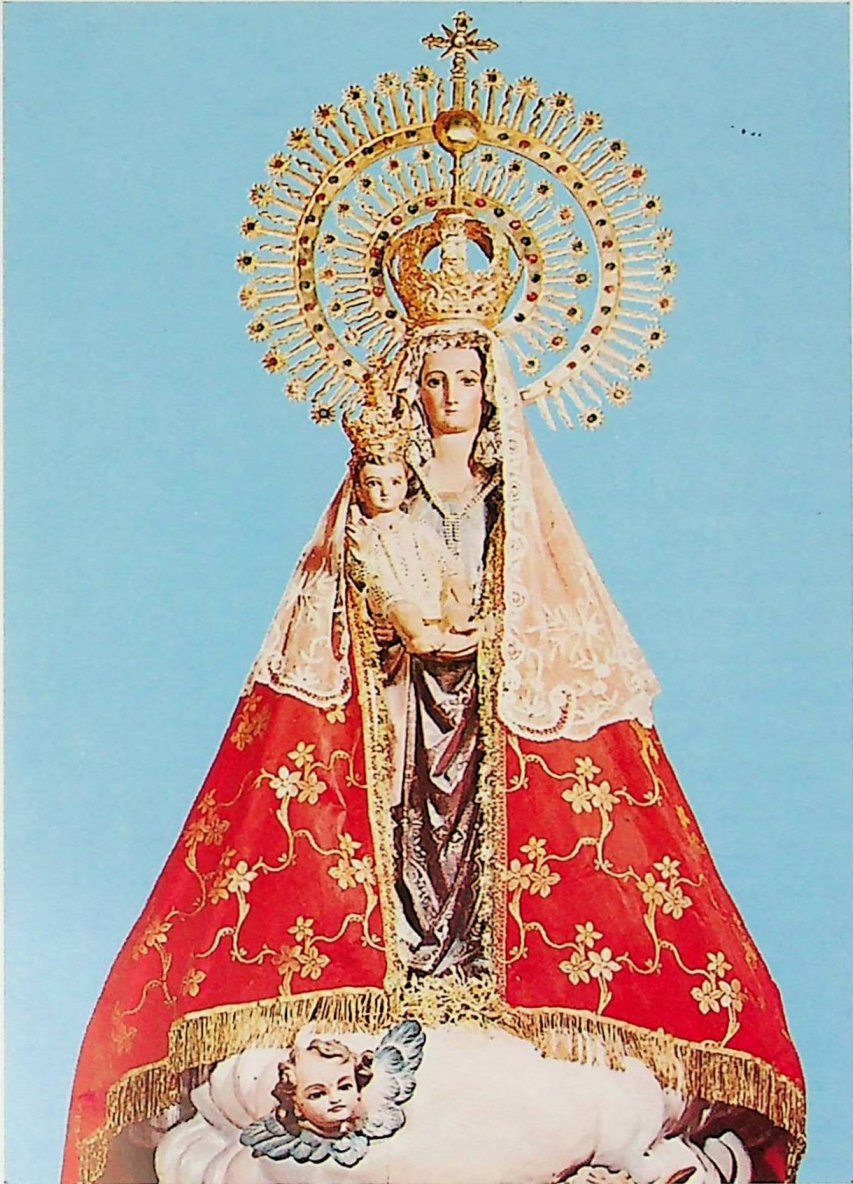
Ntra. Sra. de la Consolación EXCELSA PATRONA DE INIESTA